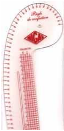
Règle courbe de confection

Pour les aides au patronnage un perroquet (pistolet ou french curve), une règle de confection, une règle courbe de tailleur ainsi qu'une équerre peuvent vous être utiles. Sans oublier la règle plate que l'on utilise pour le patch, très utile pour les tracés rectilignes ainsi que le marquage des coutures et les ourlets par exemple.