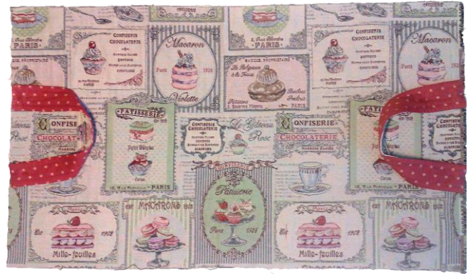
Les coudre au plus près du bord. On obtient ceci