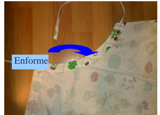
Envers du tablier

Préparer les ourlets aux extrémités et piquez-les, puis poser les enformes sur le tablier endroit de l'enforme contre endroit du tablier , piquer à 0,5cm, rabattre sur l'envers; Marquer au fer un repli et piquer au plus près du bord. Vous obtenez une gorge de 2 cm de large. C'est dans cette gorge que coulissera le lien.